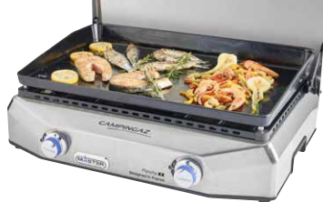
Master Plancha EX 3000004799

10 Jahre Garantie gegen Durchrostung auf die Edelstahlbrenner und die emaillierte, gusseiserne Planchaplatte