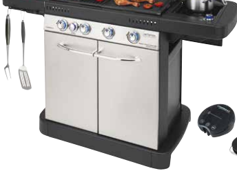
Master 4 Series Classic SBS 3000005019

Inklusive Bluetooth BBQ Thermometer zur exakten Temperaturüberwachung