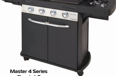
Master 4 Series Classic LS 2000032426

Emaillierter Deckel für ein elegantes Aussehen und lange Haltbarkeit Robuste Seitentische mit genug Platz für alles, was beim Grillen gebraucht wird Rollen mit Bremsen für einfaches Bewegen und sicheren Stand Kratzresistente Lackierung auf den Seitenablagen für einfache Pflege und Langlebigkeit 10 Jahre Garantie gegen Durchrostung auf die Edelstahl-Rohrbrenner 5 Jahre Garantie gegen Durchrostung auf die emaillierten gusseisernen Grillroste